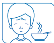
Perte de l'odorat ou du goût