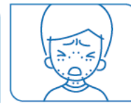
Changements à la peau ou éruptions cutanées