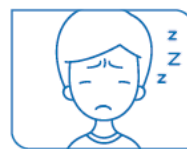
Sensation générale de malaise