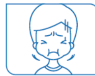
Nausée ou vomissements