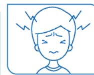
Mal de tête