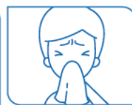
Congestion ou écoulement nasal